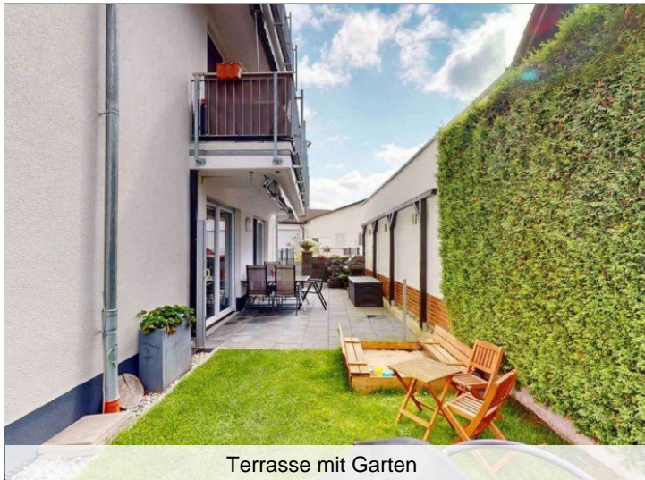
Terrasse mit Garten