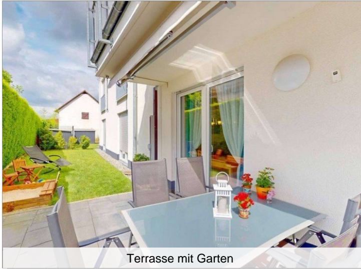
Terrasse mit Garten